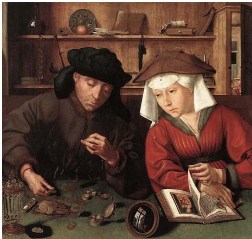
Рис. 1. Картина Квентіна Матсіса "Лихвар із дружиною"